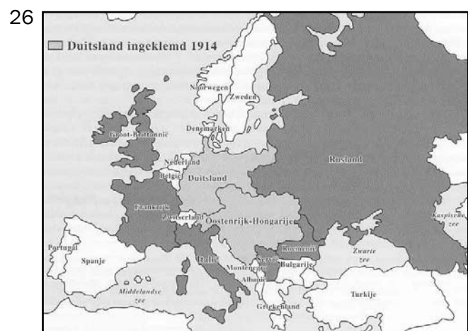
Duitsland ingeklemd 1914

De lichte grijze landen zijn bondgenoten van Duitsland, de donkere de vijandig gezinde landen.