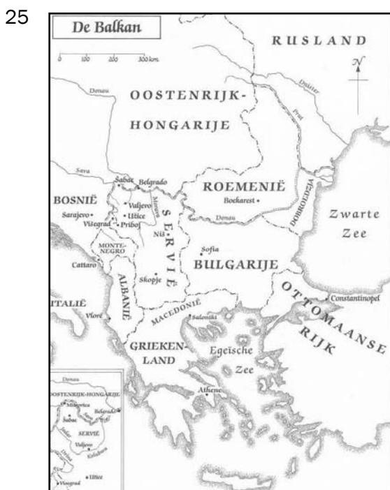
De Balkan in 1914