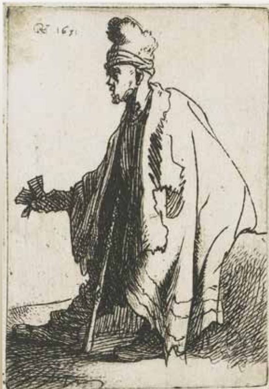
De leproos moest met een klepper lopen om zijn komst aan te kondigen. Ets van Rembrandt, 1631.

er het idee dat de zieke als uitverkorene werd beschouwd, maar dit idee werd door minder mensen omarmd. Ze waren uitverkoren door God om te lijden en als voorbeeld te dienen voor de christelijke gemeenschap. Het idee dat ziek zijn een straf was van God bleef over het algemeen, en zeker voor de leprozen zelf, het overheersende idee. Deze opvatting over lepra kwam al in de oudheid voor en in het Oude Testament wordt er in verschillende