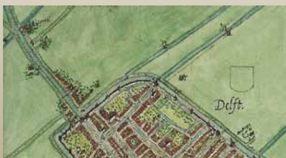
Links: De leprozerie van Delft lag aan de belangrijkste toegangsweg naar de stad. Detail uit de kaart van Jacob van Deventer. Uit de Atlas des villes des Pays-Bas, 1550-1565 (Bibliotheca Digital Hispánica). Rechts: De leprozerie van Brugge was omringd door een muur, maar lag maar op een steenworp afstand van de stadsmuren. Detail van de kaart van Jacob van Deventer, 1558.

Stadskeuren zorgden er vanaf de hoge middeleeuwen voor dat ze ook onder de wet één groep vormden. Ze mochten zich niet meer binnen de stadsmuren vertonen of de mis in de parochiekerk bijwonen. De leprozen probeerden dan om een eigen kapel te nemen, een eigen kerkhof aan te leggen en een eigen priester aan te wijzen. In het Derde Concilie van Lateranen (1179) werd bepaald dat alle kapellen waar leprozen woonden geestelijke ►