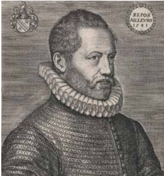
Portret van Filips van Marnix van Sint-Aldegonde. Prent van Johannes Wierix, 1581. Collectie Rijksmuseum.