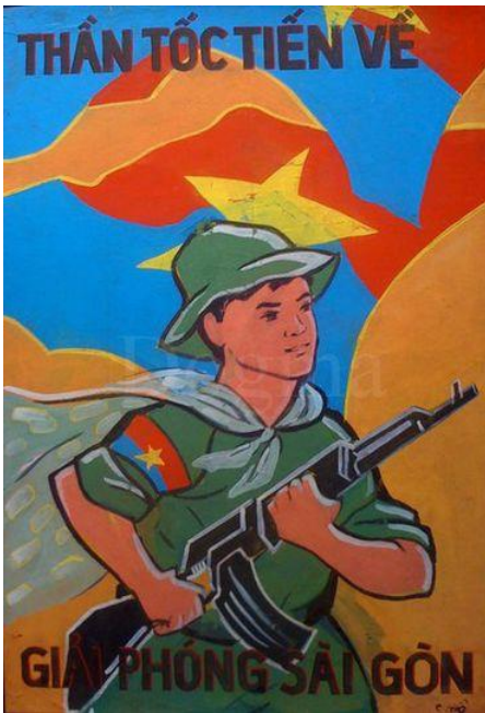
“Met de jeugd voorop, bevrijden we Saigon” (hoofdstad van Vietnam), propagandaposter van de Vietminh uit 1951.