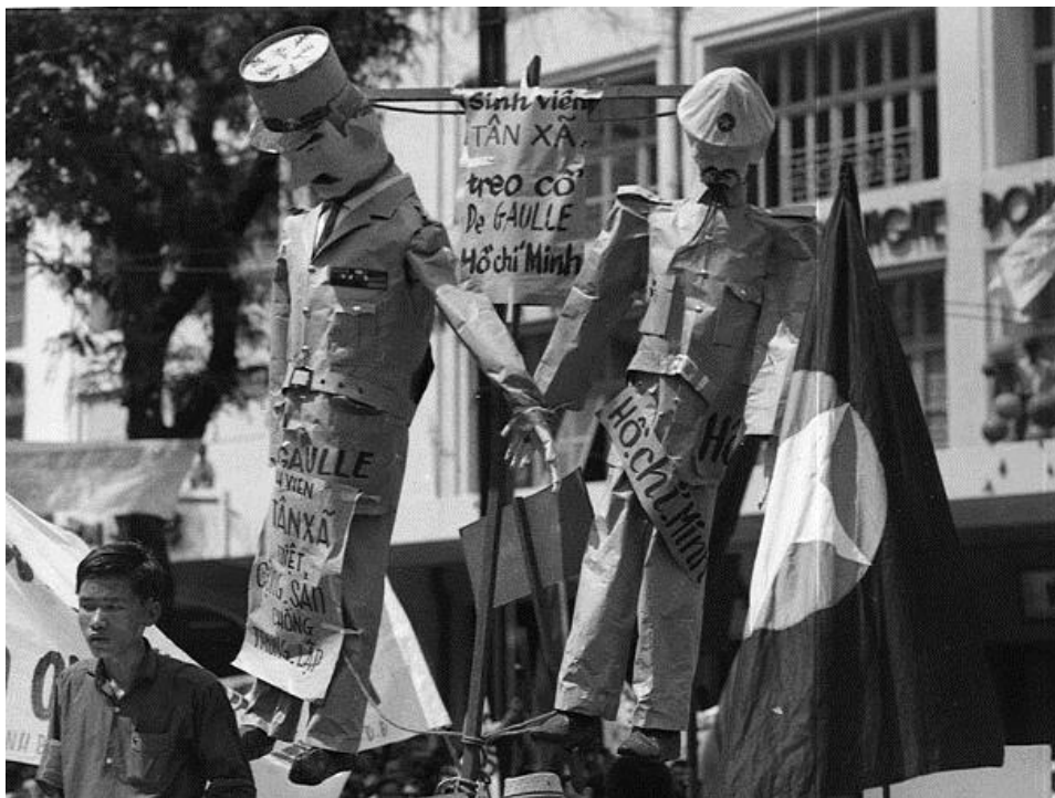
Twee door Vietnamese studenten gemaakte poppen verbeelden de samenwerking tussen Hồ Chí Minh en de Franse president. Foto genomen tijdens de onafhankelijkheidsonderhandelingen in 1945.