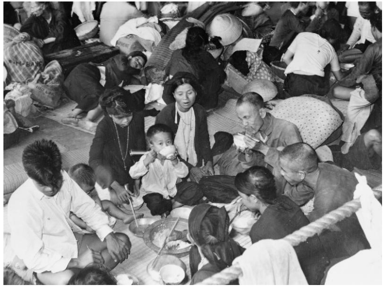
Bewoners van de havenstad Haiphong delen eten in een evacuatie ruimte na een zwaar bombardement in 1946.