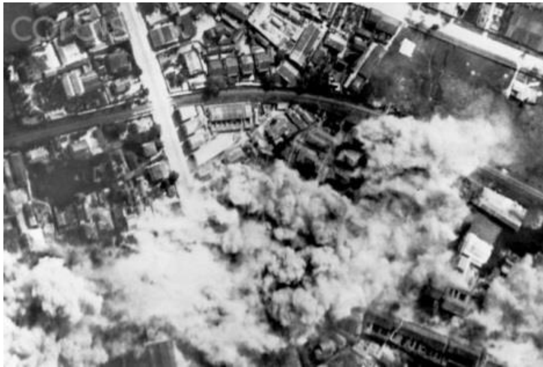
Bombardement van het centrum van de havenstad Haiphong, 1946. Er staan enkele fabrieken tussen de woonwijken in gebouwd.