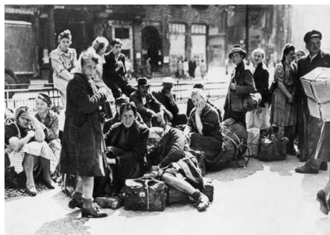
Heimatvertriebene wachtten op de trein die hen naar het westen zal deporteren, 1946.

Op een dag speelde zich een vreselijk tafereel af dat ons heel diep raakte. Vier Poolse soldaten probeerden een jong meisje van haar ouders, die haar wanhopig vasthielden, te scheiden. De Polen sloegen de ouders met hun geweerkolven, vooral de man. Hij wankelde op zijn benen, en ze duwden hem over de straat de dijk af. Hij viel neer, waarop een van de Polen zijn machinegeweer pakte en een aantal schoten afvuurde. Heel even was er een dodelijke stilte, waarna het geschreeuw van de twee vrouwen door de lucht sneed. Ze renden naar de stervende man toe en de vier Polen verdwenen in het bos.'