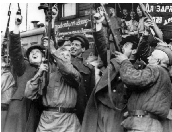
Russische soldaten in Oost-Pruisen vieren de overgave van nazi-Duitsland, 8 mei 1945.

* Bron 1 Toen het Rode Leger in 1944 naar Berlijn oprukte, sloegen miljoenen inwoners in het oosten van Duitsland op de vlucht. In de chaos kwamen velen om het leven. Naar schatting een miljoen Duitse vrouwen werden door Russische soldaten verkracht. In 1985 verklaarde een Russische vrouw die in de oorlog in het Rode leger had gediend: 'In elke stad die we bezetten, kregen we drie dagen de tijd voor plundering en verkrachting. Dat was niet officieel natuurlijk, maar zo ging dat. Wel kon je na drie dagen voor de krijgsraad gesleept worden als je zoiets deed. Ik herinner mij een verkrachte Duitse vrouw die naakt lag met een handgranaat tussen haar benen. Nu schaam ik mij, maar toen voelde ik die schaamte niet. Denk je dat het makkelijk was om het de Duitsers te vergeven? We wilden ze zó bang maken, dat ze nooit meer oorlog tegen ons zouden voeren. Ik haatte het om hun nette, onbeschadigde, witte huizen te zien. En witte rozen. Ik wilde dat ze leden. Ik wilde hun tranen zien. Er gingen tientallen jaren voorbij voordat ik medelijden voor hen ging voelen.'