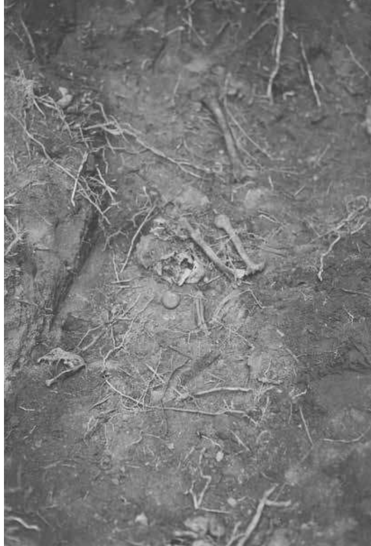
Stoffelijke resten van een door de Japanners geëxecuteerde Nederlandse of Australische krijgsgevangene op Ambon, 1942.