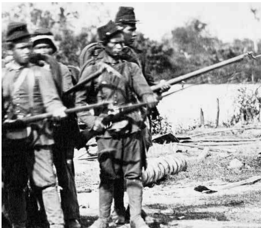
Ambonese soldaten tijdens de tweede expeditie naar Atjeh, 1874.

nood op Java, de wreedheden die begaan zijn tegen burgers, zoals in Putten en op Babar, en de keuzes die burgers maken in tijden van oorlog door zich te verzetten, mee te werken of zich aan te passen. Zo kunnen docenten geschiedenis een verhaal bieden dat een grotere diversiteit aan historische feiten bezit en waar Nederlandse leerlingen met diverse achtergronden zich in herkennen. ●