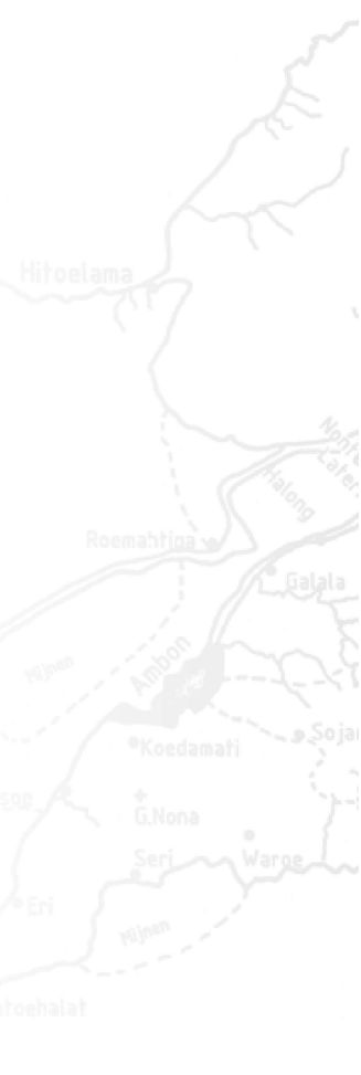
Linkerpagina: Kaart van de verdedigingswerken rond Ambon, begin 1942. Op de kaart zijn duidelijk de verschillende mijnenvelden te zien die een landing van de Japanners moesten bemoeilijken. Boven: Tekening van kamp STOVIL, waar in 1942 alle Europese burgers die op de Molukken woonden gevangenzaten. Voor de oorlog was dit de School tot Opleiding van Inlandse Leraren.

Vanuit het Nederlandse perspectief is er een duidelijke agressor: Japan. Opvallend genoeg stuurde het Nederlands-Indisch bestuur na de aanval op Pearl Harbor nog vóór zijn bondgenoten een oorlogsverklaring aan Japan. Voor Japan, dat door spionage een goede inschatting had kunnen maken van de sterkte van het Nederlands-Indisch leger, kwam de verklaring als een verrassing. In eerste instantie weigerden de Japanners dan ook de oorlogsverklaring. De Nederlanders konden niet serieus zijn, hun leger en vloot waren veel zwakker dan die van Japan. Waarom dan toch die oorlogsverklaring? Een deel van het antwoord is te vinden in het onderschatten van de macht van Aziatische tegenspelers. Zo negeerde en onderdrukte Nederland als koloniaal bestuurder in de periode voor de onafhankelijkheid van Indonesië stelselmatig de wens tot zelfbestuur die onder de bevolking leefde. Leaders van de vooroorlogse Indonesische nationalistische beweging, zoals Soekarno, Hatta en Sjahrir, werden door het Nederlands-Indische gouvernement tot ballingschap veroordeeld. Het idee dat Europeanen superieur zijn, speelde ook zeker mee bij de zelfoverschatting ten opzichte van het Japanse leger. ▶