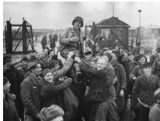
bron 1 – Krijgsgevangenen uit de Sovjet-Unie tillen uit vreugde een Amerikaanse soldaat op.