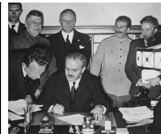
bron 6 – De Duitse en Sovjet-minister van buitenlandse zaken tekenen een verdrag. Stalin staat lachend op de foto.

bron 3 – 'De broer van Vladimir, Aleksandr, besluit de autoriteiten een brief te sturen, waarin hij zijn beklag doet over de negatieve gevolgen van de collectivisatie. Aleksandr wordt door de geheime politieke politie opgepakt. De aanklacht luidt dat Aleksandr hulp heeft verleend aan politieke tegenstanders. Nog geen drie weken later wordt hij veroordeeld tot tien jaar dwangarbeid.'