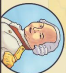
Graaf Van Rochambeau Generaal onder Napoleon

Het blijft onrustig op het eiland. Napoleon is aan de macht gekomen in Frankrijk. In Parijs wordt hij bevestigd door plannet die hem overtuigen om een einde te maken aan de vrie status van de Haïtianaan. Hij stuurt troepen onder leiding van Graaf van Rochambeau om orde op zaken te stellen. Louverture wordt gearresteerd. De opstandelingen, onder leiding van de nieuwe leider Dessalines, bieden voldeende tegenpartij en de Fransen verliezen hun grip op het eiland. Ze worden verjaagd van het eiland en Haïti wordt in 1804 de tweede moderne onafhankelijke staat in de 'Nieuwe Wereld'. De campagne is een militair en economisch fiasco voor Napoleon.