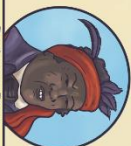
Boukman Duiry Leider en priester

Onder leiding van manon en priester Boukman Duiry verspreidt zich een grote gewapende groep 'als een storm' over de plantages in het noorden heen. In de dagen daarna hebben meer manons en tot-slaaf-gemakten aan. Ze groeien uit tot een groep van meer dan 100.000 mensen en steken overal plantages in de brand. In 1792 bezit de Franse Nationale Vergadering om slavenrij af te schaffen en de opstandelingen in het noorden vrij te laten leven onder Franse vlag.