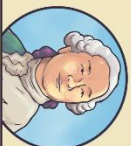
Lodewijk XVI De Franse koning

Saint-Domingue is een van de belangrijkste suikerproductoren van de achttiende eeuw op de wereld en een belangrijke kolonie voor Frankrijk. Op dit eiland van het eiland liggen honderden rijkswaardpunten waarop duizenden slaven onder slechte omstandigheden moesten werken. De Franse plantagehouders staan bekend als erg wreed. Elke dag komen er in de huizen nieuwe slaven aan, maar het is ook een plek waar nieuwe ideeën uit alle windstreken samenkomen.