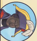
Toussaint Louverture Leider

In 1793 verklaart Groot-Brittannië de oorlog aan Frankrijk. Om ook in andere kolonies slavenopstandelingen te voorkomen vallen de Britten Saint-Domingue binnen. Daar hebben ze tegen de groep opstandelingen onder leiding van Toussaint Louverture. Spanje zou later ook kant kiezen voor de Britten. De inna van beide Europese landen krijgt veel kritiek van abolitionisten. De revolutie komt tijdelijk in zwart weer als er onduidelijke spanningen ontstaan. Uiteindelijk zou Louverture, samen met de Fransen, het eiland verenigen en de Britten en de Spanjaarden verdrijven.